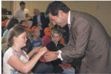
▲ Een CittasTour oranje petje en button horen er ook bij